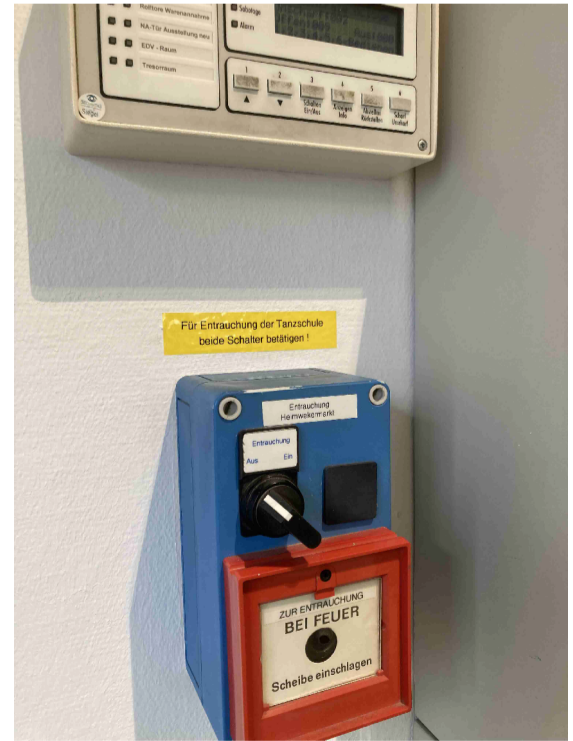
Auslösestelle RWA-Lüftungs- aggregat Bestand