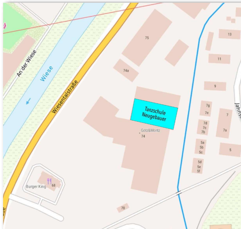
Lage Tanzschule in Gebäude und auf Areal

Die angrenzenden Gebäude und Gebäudeteile ausserhalb der Markierung, vgl. a. Planeintragungen in Anlage 1, gehören nicht zur Tanzschule.