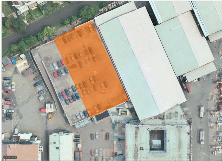
Lage Tanzschule in Gebäude und auf Areal

Das Dach des Gebäudes ist als Parkplatzfläche für PKW ausgebildet, vgl. a. Planauszüge.